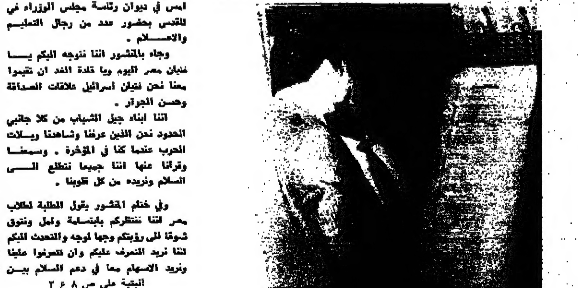
البيبة على ص ٢٤٨

القدس - من مجد ناصرة - قدم امس مجلس طلاب القدس الى الدكتور الياهو بن اليسار اول مستشار اسرائيل في مصر بمناسبة سفره الى القاهرة منشورا الى الطلاب مصر وثباتها وقد حضر برفقة اعضاء مجلس الطلاب حوالي 100 طالب يمثلون جميع مدارس العاصمة .